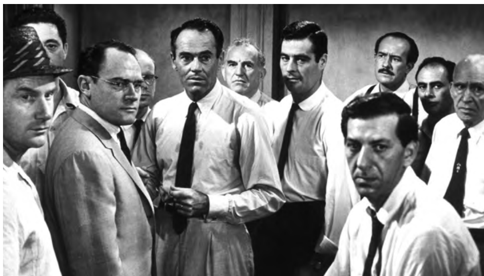
Dvanáct rozhněvaných mužů (režie: Sidney Lumet, 1957)